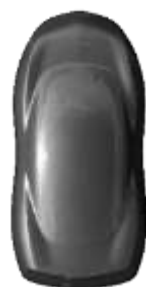
Gri 'Titanium' metallic