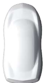
Alb 'Blanc Icy' (Standard)