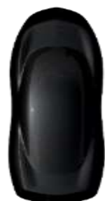
Negru 'Perla Nera' metallic