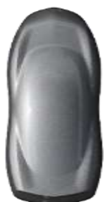
Gri Artense metallic