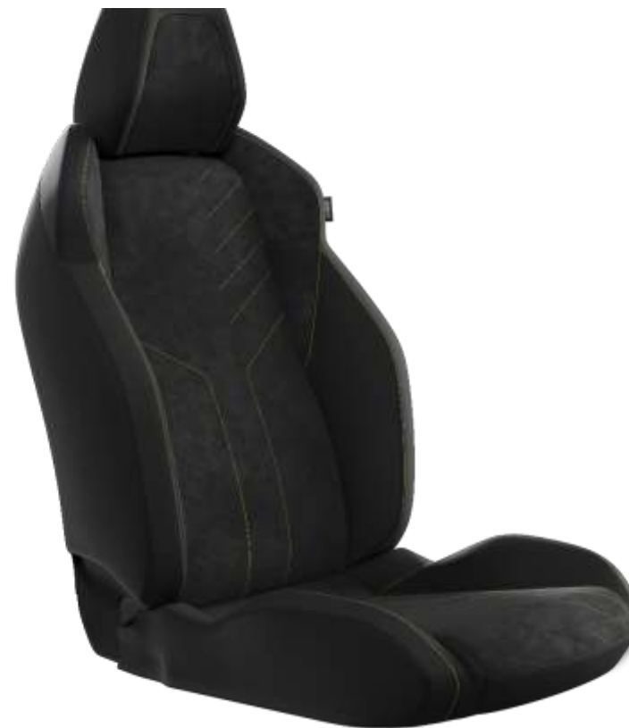
Tapîțerie Mistral ICONIUM Alcantara® cu tapîțerie TEP Isabella, Alcantara neagră și cusături Adamite Green