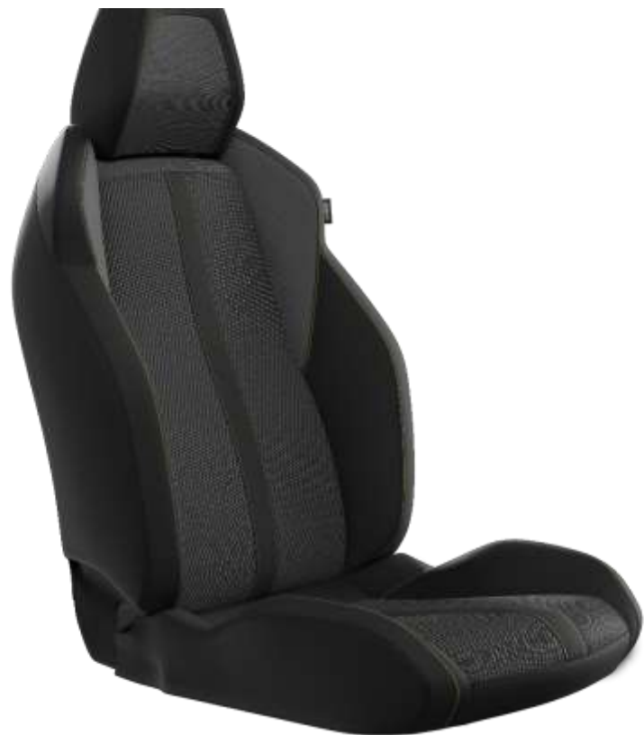
Tapîțerie din țesătură BELOMKA, cu TEP Isabella, tapîțerie Uni Copy și cusături Adamite Green