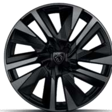
Jante diamantate bi-ton EVISSA din aliaj de 18"

Standard pe nivelele de echipare ALLURE și GT