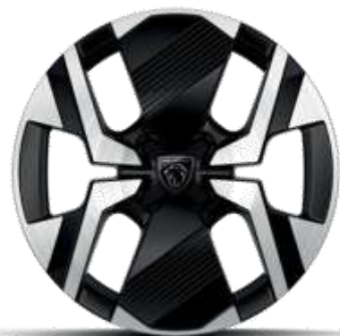
Jante diamantate bi-ton KARAKOY din aliaj de 17"

Standard pe nivelele de echipare ALLURE și GT